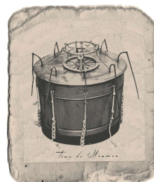
Hierboven Mesmer's Baquet: het magnetiseerapparaat waarmee Franz Mesmer werkte. Links een pagina uit de Illustrated Practical Mesmerist, 1854.